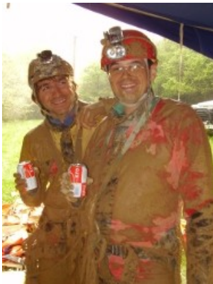
A la sortie de la Fontarrasse

10 : classique dans le réseau du Verneau par le Bief Bousset (Doubs) organisé par le Chourum de Veynes. Très belle sortie, guidée par